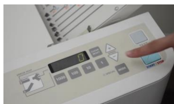
หน้าจอแสดงการนับจำนวน และการตั้งค่าความเร็ว