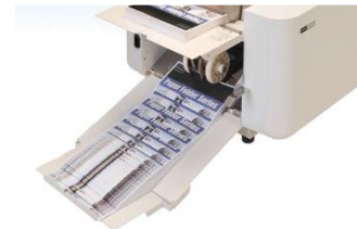
ถาดขาออกขนาดใหญ่