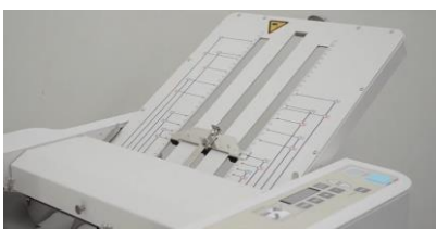
ปรับตั้งระยะพับด้วยระบบ manual ไม่ยุ่งยาก